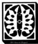
Amici di Gropoli