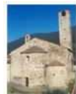
Pieve di Legri