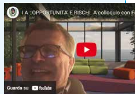
Immagine dal sito: uno dei "Colloqui" dei mesi scorsi, sul tema dell'AI Intelligenza Artificiale.