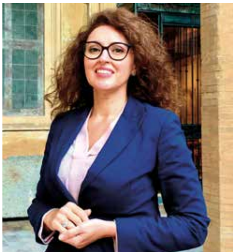
Maria Teresa Bellucci, Viceministro del Lavoro e delle Politiche Sociali